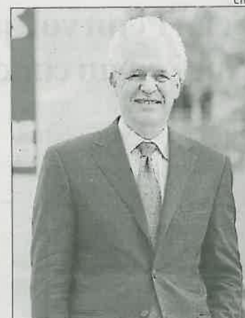
Richard K. Lester

La jornada, que vol tenir continuïtat anual, tindrà tres eixos: acadèmia, administracions i empresa, i es proposa reforçar els llaços entre aquests tres àmbits per fonamentar la recuperació econòmica en un model basat en la innovació i la recerca. La conferència té un pressupost d'uns 10.000 euros i preveu una assistència de 150 convidats pel CTM.