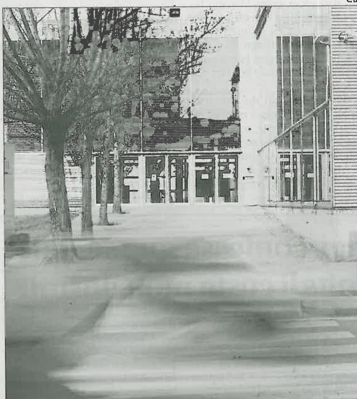
Façana del CTM Centre Tecnològic, a Manresa